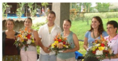
Comentarios de los estudiantes:

Nuestro deseo es que el estudiante disfrute de una experiencia diferente, que sin duda traerá cambios en su vida.